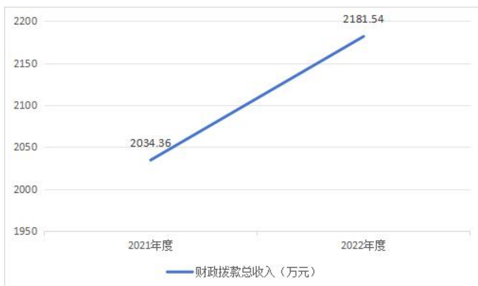
图 4：财政拨款收、支决算总计变动情况

调，机关养老保险、社会保障缴费、医保缴费增加。政府性基金预算财政拨款收入 146.6 万元，比 2021 年度决算数增加 67.39 万元。增加主要原因是建设用地植被恢复及使用林地调查、可行性报告编制费政府性基金预算资金。国有资本经营预算财政拨款收入 0.11 万元，比 2021 年度决算数增加 0.11 万元。增加主要原因是国有企业退休人员社会化管理补助支出。