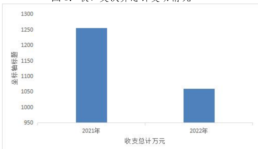
图 1: 收、支决算总计变动情况