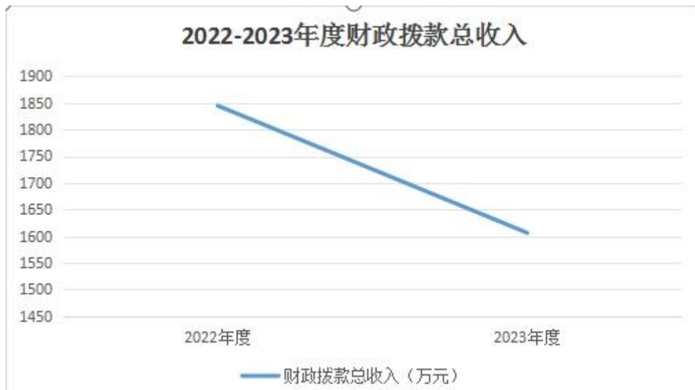
图 4：财政拨款收、支决算总计变动情况

1606.33 万元，比 2022 年度决算数减少 238.2 万元，下降 12.91%。减少主要原因：一是学校基本建设支出减少；二是学生数减少，公用经费减少。